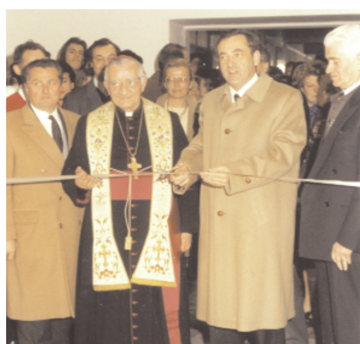
Febbraio 1992: inaugurazione della nuova ala